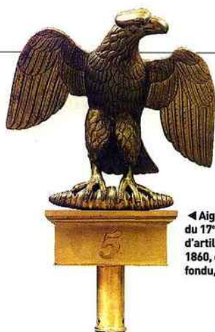
◀ Aigle de drapeau du 17 e régiment d'artillerie, modèle 1860, en aluminium fondu, cuivré et doré.

BP 419 77309 FONTAINEBLEAU CEDEX - 01 60 39 69 69