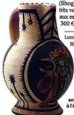
◀ Pichet au coq daté 1954, en terre cuite blanche, peinture à l'émail. Signé Edouard Pignon. H. 33,5 cm.

Lundi 23 mars, à 14 h, à Drouot-Richelieu, 9 rue Drouot, 75009 Paris. Exposition le 21, de 11 h à 18 h ; le 23, de 11 h à 12 h. Europ Auction. Tél. 01 42 46 43 94.