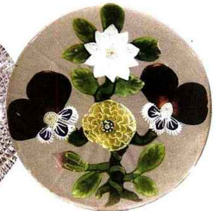
▲ Rare presse-papiers en cristal de Baccarat. Estimé 7 000 à 8 000 €.

► Lundi 23 mars, à 14 h 15, à Drouot-Richelieu (salle 3), 9 rue Drouot, 75009 Paris. Exposition le 21 de 11 h à 18 h ;