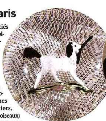
▲ Rare presse-papiers en cristal de Saint-Louis avec décor en inclusion. Estimé 1 500 à 2 000 €.

La vente se terminera par un ensemble de cristal et verrerie, dont un gobelet de Baccarat au décor finement gravé attribué à Charpentier, vers 1820, estimé 400 à 500 €.